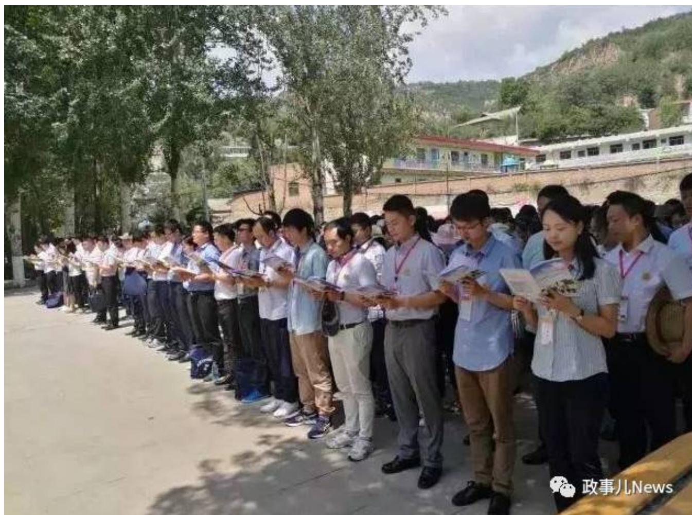
选调生在读《之江新语》

17日下战书，卖力选调生的西安市委组织部青年干部处一名事情职员向“政事儿News”（微信ID: zsenews）表现，现在，这批选调生已经最先走向事情岗位，这些心得是在业余时间自觉组织学习的。